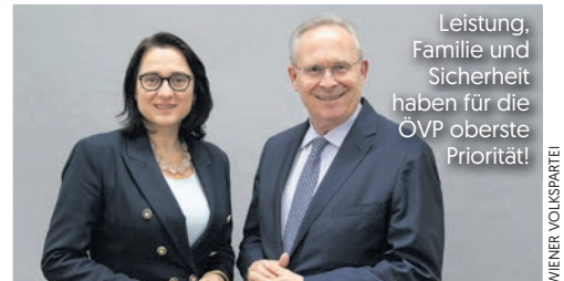
Leistung, Familie und Sicherheit haben für die ÖVP oberste Priorität!

Außerdem werden 60 Millionen Euro für einen „Wohnschirm“ bereitgestellt, um der Teuerungswelle entgegenzuwirken, zur Unterstützung von Mieter:innen, die durch Mietschulden von Wohnungsverlust und Delogierung bedroht sind.