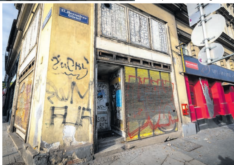
Die meisten Erdgeschosszonen rund um den Gürtel werden nicht genutzt. Wir sind uns einig: Es steckt noch so viel mehr Potenzial in diesen Gegenden.