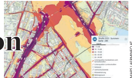
Lärmkarte des Brigittenauer Verkehrsknotens.

Besonders im Sommer, wenn die Anwohnerinnen und Anwohner abends die Fenster öffnen, ist dieser Lärm sehr deutlich wahrzunehmen und wird als besonders störend empfunden. Unsere Forderungen in der Bezirksvertretungssitzung, die wir bereits im November 2022 gestellt haben, nach Verbesserung der derzeitigen Lärmschutzmaßnahmen im Bereich des Verkehrsknotens wurden leider von der damaligen Bezirksvorstehung ig-