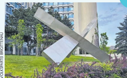
LÖSUNG: Die Nirosta-Plastik „Offener Raum“ auf dem Gelände der AUA