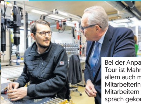
Bei der Anpacker-Tour ist Mahrer vor allem auch mit den Mitarbeiterinnen und Mitarbeitern ins Gespräch gekommen.

Außenminister Alexander Schallenberg: „Familienunternehmen wie Heindl sind das Rückgrat unserer Wirtschaft. Ich habe mich sehr gefreut, Einblick in das umfangreiche Repertoire der Confiserie zu erhalten. Besonders begeistert war ich von der hohen Qualität und der Umsicht und Hingabe in der Produktion. Die verschiedenen Schokoladenkreationen werden weltweit exportiert und sind, wenn man so will, Botschafter süßer österreichischer Handwerkskunst.“