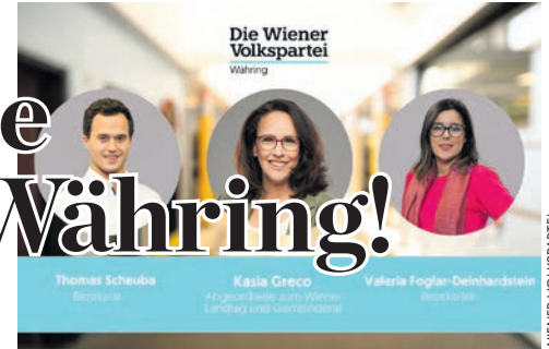
Die Wiener Volkspartei Währing

Erfolgreiche Arbeit: 4-Parteien-Antrag wurde angenommen.