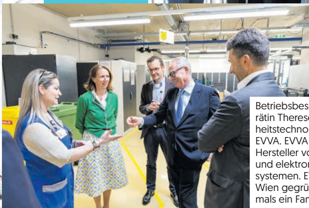
Betriebsbesuch mit Nationalrätin Therese Niss beim Sicherheitstechnologie-Unternehmen EVVA. EVVA ist Entwickler und Hersteller von mechanischen und elektronischen Zutrittsystemen. EVVA wurde 1919 in Wien gegründet und ist seit damals ein Familienunternehmen.

über 110 Mitarbeitern und einem jährlichen Verkauf von mehr als 77.000 Fahrzeugen ist Mazda Rainer der größte Mazda-Händler des Landes. Die übergeordnete Rainer-Gruppe ist zudem in Bereichen wie Immobilien, Hausverwaltung, Filmproduktion und Hotellerie tätig und beschäftigt insgesamt 380 Mitarbeiter aus 29 Nationen. „Man gewinnt als Politiker bei derartigen Firmenbesuchen nicht nur Einblicke in den Arbeitsalltag, sondern lernt auch weit besser kennen, wie krea-