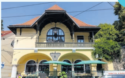
DIE WIENER VOLKSPARTEI