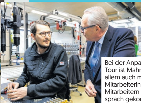
Bei der Anpacker-Tour ist Mahrer vor allem auch mit den Mitarbeiterinnen und Mitarbeitern ins Gespräch gekommen.

Außenminister Alexander Schallenberg: „Familienunternehmen wie Heindl sind das Rückgrat unserer Wirtschaft. Ich habe mich sehr gefreut, Einblick in das umfangreiche Repertoire der Confiserie zu erhalten. Besonders begeistert war ich von der hohen Qualität und der Umsicht und Hingabe in der Produktion. Die verschiedenen Schokoladenkreationen werden weltweit exportiert und sind, wenn man so will, Botschafter süßer österreichischer Handwerkskunst.“