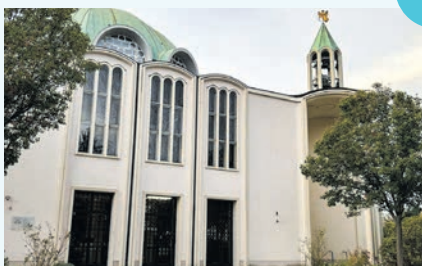
LÖSUNG: Pfarre Gatterhözl