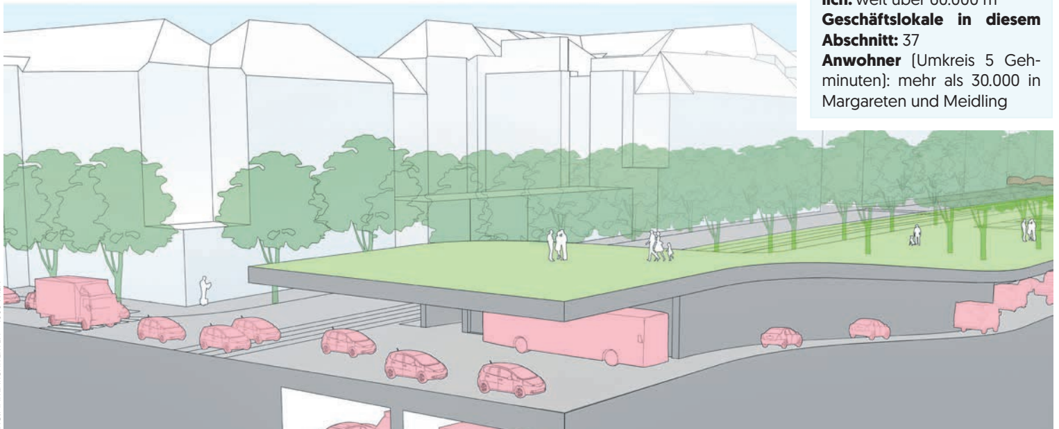
Erste Skizzen: So könnte der Gürtel in Zukunft aussehen – ein Lebensraum für alle!

Anwohner (Umkreis 5 Gehminuten): mehr als 30.000 in Margareten und Meidling