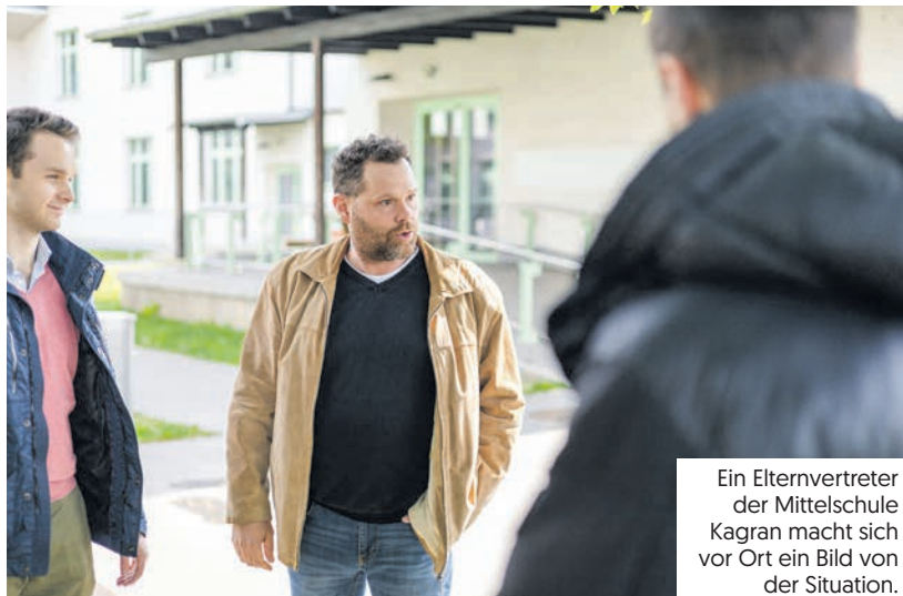
Ein Elternvertreter der Mittelschule Kagran macht sich vor Ort ein Bild von der Situation.