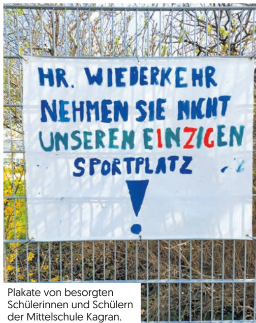
Plakate von besorgten Schülerinnen und Schülern der Mittelschule Kagran.