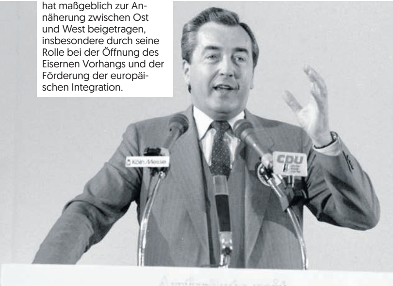
Alois Mock war eine bedeutende Figur in der europäischen Politik. Er hat maßgeblich zur Annäherung zwischen Ost und West beigetragen, insbesondere durch seine Rolle bei der Öffnung des Eisernen Vorhangs und der Förderung der europäischen Integration.

Andreas Khol hat als österreichischer Politiker bedeutende Beiträge zur Vertiefung der europäischen Integration geleistet, indem er sich für eine konstruktive Zusammenarbeit innerhalb der EU sowie für eine Stärkung der europäischen Werte und Institutionen eingesetzt hat.