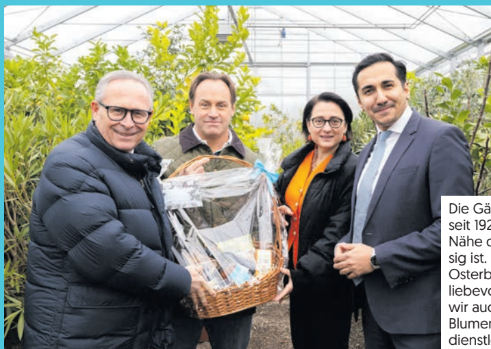
Die Gärtnerei JANDL ist ein Familienbetrieb seit 1927, der an der Stadtgrenze Wiens in der Nähe des Stammersdorfer Friedhofs ansässig ist. 2011 wurde er von der Familie Jezik-Osterbauer übernommen. Spezialisiert auf liebevolle Grabgestaltung und -pflege, bieten wir auch eine Vielfalt an heimischen Pflanzen, Blumensträußen und professionellen Gartendienstleistungen.

Mit 23 Mitarbeiterinnen und Mitarbeitern ist die Gärtnerei Jandl nicht nur ein Eldorado für Blumen, sondern auch ein verlässlicher Arbeitgeber im Bezirk. „Es ist wirklich beeindruckend, zu sehen, mit wie viel Ehrgeiz und Freude die Familie ihr Handwerk treibt. Man sieht, dass Floristik hier mehr als nur ein Beruf ist – es ist eine Leidenschaft der Familie.“