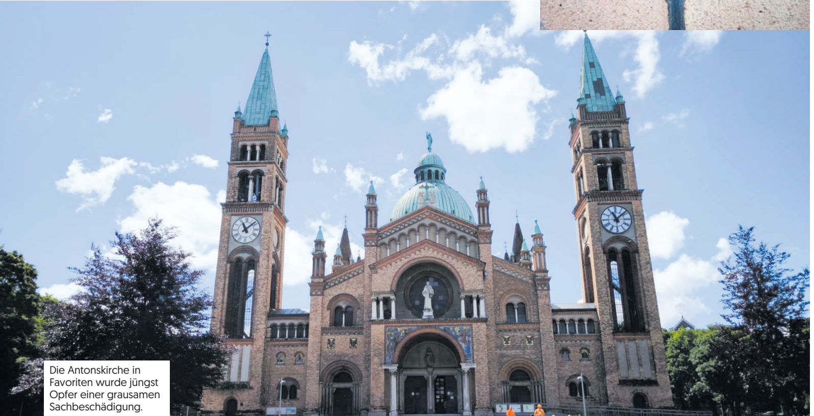
Die Antonskirche in Favoriten wurde jüngst Opfer einer grausamen Sachbeschädigung.

als alle Bundesländer und ist damit auch verantwortlich dafür, dass sich die unterschiedlichen Communities in Wien bereits