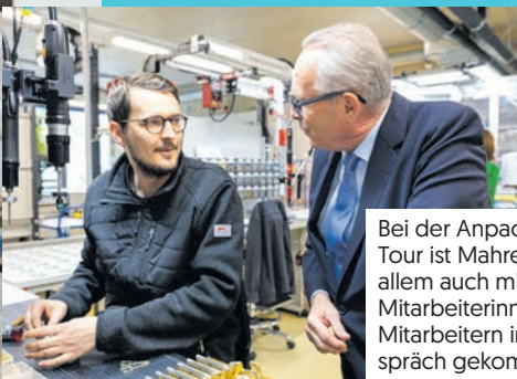
Bei der Anpacker-Tour ist Mahrer vor allem auch mit den Mitarbeiterinnen und Mitarbeitern ins Gespräch gekommen.

Außenminister Alexander Schallenberg: „Familienunternehmen wie Heindl sind das Rückgrat unserer Wirtschaft. Ich habe mich sehr gefreut, Einblick in das umfangreiche Repertoire der Confiserie zu erhalten. Besonders begeistert war ich von der hohen Qualität und der Umsicht und Hingabe in der Produktion. Die verschiedenen Schokoladenkreationen werden weltweit exportiert und sind, wenn man so will, Botschafter süßer österreichischer Handwerkskunst.“