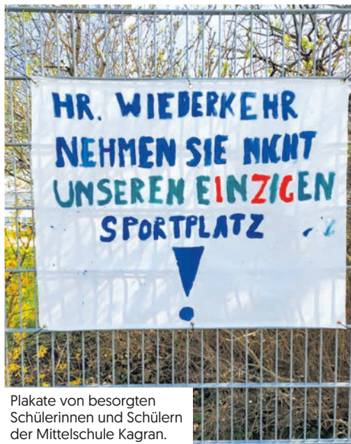
Plakate von besorgten Schülerinnen und Schülern der Mittelschule Kagran.