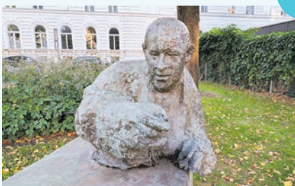
LÖSUNG: Erwin-Ringel-Denkmal am Schlickplatz