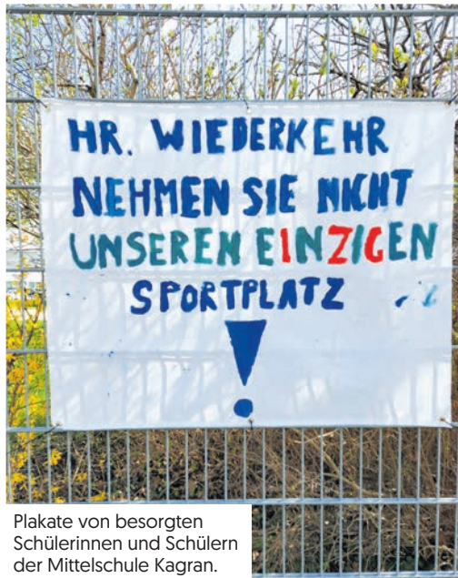
Plakate von besorgten Schülerinnen und Schülern der Mittelschule Kagran.

Da ist dann aber gar nichts gekommen außer dem Standardsatz, dass das notwendig und alternativlos ist, also genau das, was Stadtrat Wiederkehr gesagt hat.