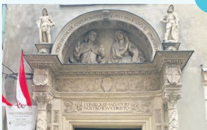
LÖSUNG: Das Renaissance-Portal aus 1520 der Salvatorkirche.