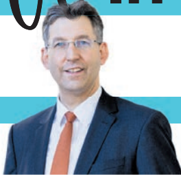
Markus Figl Bezirksvorsteher